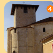
4 Eglise du XII e à Vertheuil