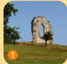
1 Vestiges de l'abbaye de l'Isle à Ordonnac

Découvrez le patrimoine du Centre Médoc avec le jeu des "8 familles" disponible dans votre office