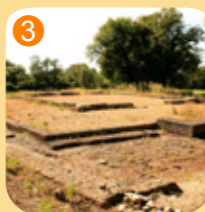
3 Site archéologique de Brion à St-Germain d'Esteuil